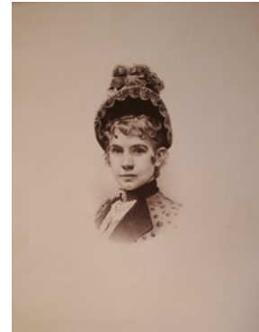
Obr. 9: Arcivojvodkyňa Gizela, litografia, 19. st.