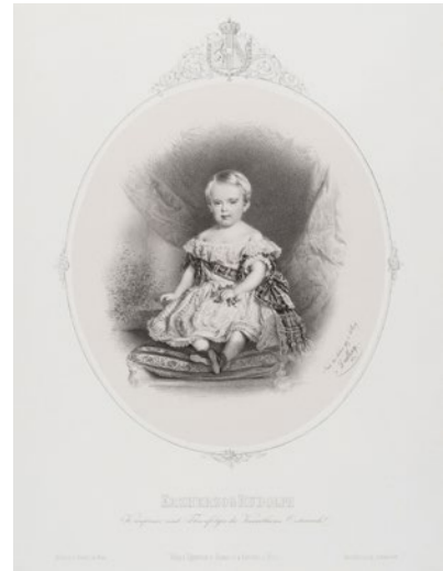
Obr. 2: Arcivojvoda Rudolf, korunný princ a následník trónu Rakúskeho cisárstva, litografia, Adolf Dauthage, 1860.

Keď sa Rudolf narodil, mal už jednu sestru Gizelu, ktorá bola o dva roky staršia.