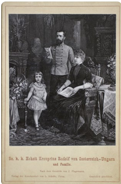
Obr. 10: Korunný princ Rudolf s rodinou, originálna fotografia podľa maľby J. Plagemanna.

V roku 1881 sa korunný princ Rudolf oženil s belgickou princeznou Štefániou . Obaja však boli veľmi rozdielni a ich manželstvo nebolo šťastné. Mali spolu jednu dcéru, arcivojvodkyňu Alžbetu Máriu. Keď jej otec v roku 1889 zomrel, mala jeho dcérka iba šesť rokov.