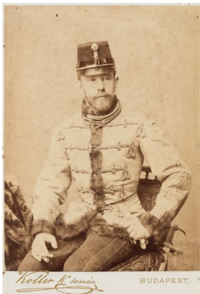
Obr. 14: Korunný princ Rudolf v slávnostnej uhorskej uniforme, fotografia, Károly Koller, 1887.

Korunný princ Rudolf musel bojovať s mnohými problémami. Na viedenskom panovníckom dvore nepatril medzi obľúbené a vplyvné postavy, bol takpovediac outsiderom. Jeho vlastný otec cisár František Jozef odmietal jeho nápady. Rudolfovi nebolo dovolené podieľať sa na tvorení štátnej politiky, hoci mal raz zasadnúť na trón obrovskej krajiny.