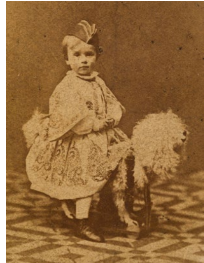
Obr. 4: Korunný princ Rudolf s plyšovým psíkom, fotografia od Ludwiga Angerera, 1860.