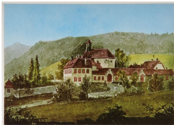
Obr. 15: Mayerling, lovecký zámok korunného princa Rudolfa, historická pohľadnica, 20. st.

Korunný princ Rudolf si vo veku tridsať rokov napokon vzal život. Dňa 30. januára 1889 bol nájdený mŕtvy spolu s jeho milenkou Mary Vetserovou na loveckom zámčoku Mayerling. Prepokladá sa, že následník trónu najprv zastrelil svoju milenkku (s jej súhlasom) a následne aj sám seba. Panovnícky dvor sa snažil túto tragédiu utajovať, aj dnes ešte existujú mnohé odlišné domnienky o príčinách smrti Rudolfa a Mary. Miesto samovraždy bolo na príkaz cisára Františka Jozefa následne prestavané na kláštor.