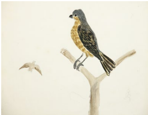
Obr. 12: Jastrab sediaci na konári a malý neznámy letiaci vták, vlastnoručná akvarelová kresba korunného princa Rudolfa, okolo roku 1868.

Korunný princ Rudolf sa zaujímal už ako dieťa o vtáky. Rád ich vlastnoručne kreslil do svojich skicárov. V neskorších časoch patril do najužšieho kruhu jeho priateľov dokonca Alfred Brehm, jeden vtedajší známy zoológ (znalec zvierat). Spoločne podnikli výskumnú cestu do uhorskej časti monarchie, kde pozorovali orly a supy. Dodnes je jednou z odvetví zoológie aj ornitológia (veda o vtákoch).