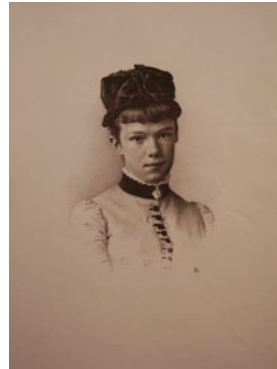
Obr. 8: Arcivojvodkyňa Mária Valéria, litografia, 19. st.

Rudolf žiarlil na svoju o desať rokov mladšiu sestru Máriu Valériu . Ich matka cisárovná Alžbeta jej totiž venovala najviac pozornosti, pričom svoje ostatné deti temer zanedbávala.