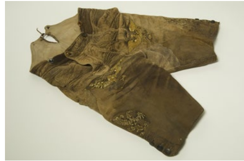
Obr. 11: Kožené nohavice korunného princa Rudolfa, okolo roku 1880.

Poľovačka bola obľúbenou kratochvíľou šľachty. Korunný princ Rudolf bol podobne ako jeho otec cisár František Jozef vášnivým poľovníkom. Už ako deväťročný skolil svojho prvého jeleňa. Na poľovačku sa vtedy nosilo ľudové oblečenie, napríklad kožené nohavice a kamizoly (kabáty).