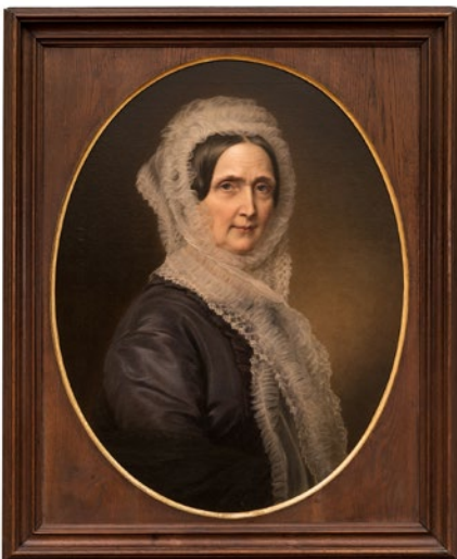
Obr. 3: Arcivojvodkyňa Žofia, olejomalba neznámeho umelca, okolo roku 1870.

Chlapec bol dlho očakávaným následníkom trónu a od začiatku boli naňho kladené veľmi veľké očakávania. Monarchia sa v čase jeho narodenia nachádzala v zložitej politickej a hospodárskej situácii. Habsburskej ríši hrozil pád neoabsolutizmu (vtedajšieho vládneho zriadenia) a v roku 1859 Habsburgovci stratili vplyv v Lombardsku, hospodársky silnom regióne v severnom Taliansku s hlavným mestom Milánom.