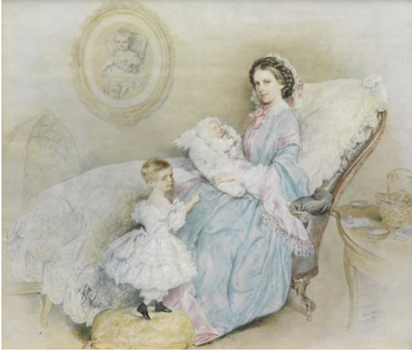
Obr. 1: Cisárovná Alžbeta s Gizelou a Rudolfom, akvarel Jozefa Kriehubera, 1858.

Korunný princ Rudolf, celým menom Rudolf František Karol Jozef, sa narodil 21. augusta 1858 na zámku Laxenburg v blízkosti Viedne. Jeho rodičmi boli cisár František Jozef (1830–1916) a cisárovná Alžbeta, nazývaná Sisi (1837–1898).