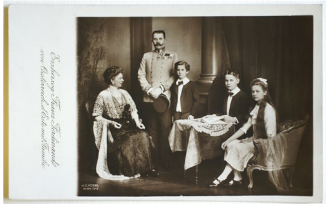
Obr. 16: Následník trónu arcivojvoda František Ferdinand s manželkou Žofiou a deťmi, pohľadnica podľa fotografie ateliéru Adèle, pred rokom 1914.

Po tragickej smrti korunného princa Rudolfa sa novým následníkom trónu stal jeho bratranec arcivojvoda František Ferdinand . Ten nebol veľmi obľúbený, pretože mal veľmi náročnú povahu. Okrem toho si vzal za manželku grófkou Žofiu Chotekovú, ktorá nebola v očiach viedenského dvora dostatočne urodzená. Cisár i dvorania preto manželov neustále potupovali, ich deti sa napríklad nesmeli stať následníkmi cisárskeho trónu. Na Františka Ferdinanda a jeho manželku Žofiu bol 28. júna 1914 v meste Sarajevo (v dnešnej Bosne a Hercegovine) spáchaný atentát. Krátko po ich zavraždení vypukla prvá svetová vojna.