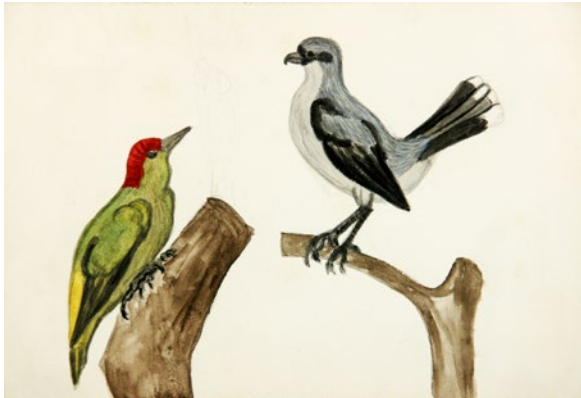
Obr. 5: Žlna zelená a strakoš sediac na konári, vlastnoručný akvarel korunného princa Rudolfa, okolo roku 1868.

Rudolf túžil po štúdiu na univerzite, ktoré mu však nebolo dovolené. V šľachtických kruhoch sa totiž štúdium nepovažovalo za vhodné pre ľudí s vysokým spoločenským postavením. Korunnému princovi bolo určené stať sa vojacom. Ako tridsaťročný bol Rudolf vymenovaný za generálneho inšpektora pechoty. V tejto funkcii kontroloval kasárne celej monarchie. Tak ako jeho otec cisár František Jozef aj korunný princ považoval vojsko za dôležitú oporu monarchie.