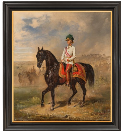
Obr. 6: Cisár František Jozef na koni v slávnostnej uniforme poľného maršala s vyznamenaním Rádu Zlatého rúna.

Rudolf túžil po štúdiu na univerzite, ktoré mu však nebolo dovolené. V šľachtických kruhoch sa totiž štúdium nepovažovalo za vhodné pre ľudí s vysokým spoločenským postavením. Korunnému princovi bolo určené stať sa vojacom. Ako tridsaťročný bol Rudolf vymenovaný za generálneho inšpektora pechoty. V tejto funkcii kontroloval kasárne celej monarchie. Tak ako jeho otec cisár František Jozef aj korunný princ považoval vojsko za dôležitú oporu monarchie.