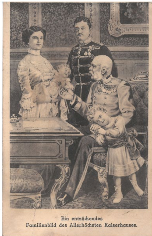
Ein entzückendes Familienbild des Allerhöchsten Kaiserhauses.

Po atentáte na Františka Ferdinanda sa následníkom trónu stal Karol , prasynovec cisára Františka Jozefa. Ten na trón nemusel dlho čakať, pretože o niečo neskôr už cisár v pokročilom veku zomrel. V novembri roku 1916, v období prvej svetovej vojny, sa tak Karol stal novým rakúskym cisárom a uhorským kráľom. Vtedy však už habsburskej ríši hrozil rozpad, ktorému sa cisárovi spolu s jeho manželkou Zitou Bourboncko-Parmskou už nepodarilo zabrániť. Dňa 11. novembra 1918 musel Karol I. podpísať vyhlásenie, že sa nebude zúčastňovať rokovaní o usporiadaní štátu. Po skončení prvej svetovej vojny v roku 1918 sa habsburská ríša nenávratne rozpadla a na jej území vznikli nové štáty: Rakúsko, Maďarsko, Taliansko, Československo, Poľsko, Rumunsko a Juhoslávia.