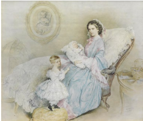
Obr. 1: Cisárovná Alžbeta s Gizelou a Rudolfom, akvarel Josefa Kriehubera, 1858.

Rudolf, vytúžený syn cisára Františka Jozefa a cisárovnej Alžbety (Sisi), sa narodil 21. augusta 1858 na zámku Laxenburg pri Viedni ako ich tretie dieťa. Jeho matka Alžbeta sa často zdržiavala na dlhých kúpeľných pobytoch v zahraničí, a tak Rudolfovu výchovu prevzala šľachtická vychovávateľka (aja) spolu s pestúnkou. Zo začiatku predstavovala výchova následníka trónu tvrdý vojenský dril. Rudolfovi obliekli už ako dvojročnému vojenskú uniformu a disciplína, poslušnosť a zocelovanie boli hlavnými princípmi jeho výchovy. Od šiestich rokov bol vychovávateľom korunného princa vysoko postavený armádny dôstojník, generálmajor gróf Leopold Gondrecourt. Ten sa usiloval chorľavého a citlivého Rudolfa telesne a duševne zoceliť prostredníctvom neľahkých