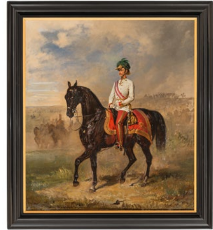
Obr. 4: Cisár František Jozef na koni v slávnostnej uniforme poľného maršala s vyznamenaním Rádu Zlatého rúna.

Rudolf bol pochovaný v Kapucínskej hrobke vo Viedni. V hlavnom meste Rakúska je po ňom dodnes pomenovaných niekoľko nemocníc (Rudolfstiftung, Rudolfinerhaus) i jeden mestský okres (Rudolfsheim-Fünfhaus). Aj mimo Rakúska jestvujú miesta, ktoré naňho spomínajú, napr. jazero Turkana vo východnej Afrike, v minulosti nazývané aj Rudolfovo jazero. Jeho meno nesie dokonca aj jedna odroda jablka – „Kronprinz Rudolf“.