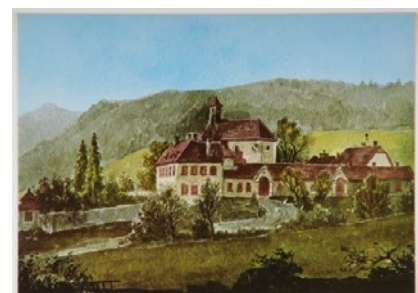
Obr. 6: Lovecký zámok Mayerling korunného princa Rudolfa, historická pohľadnica. 20. st.