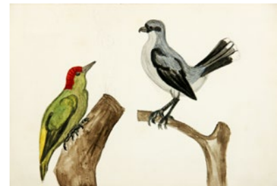
Obr. 2: Žlna zelená a strakoš sediaci na konári, vlastnoručný akvarel korunného princa Rudolfa, okolo r. 1868.

byť uznávaným vedcom a mysliteľom na základe svojich schopností, nie pre svoj stav a meno.