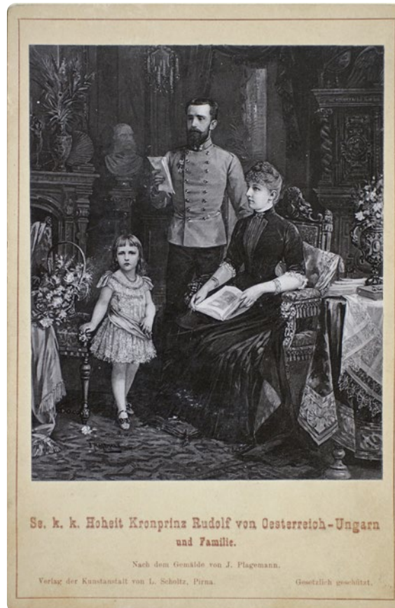
Obr. 9: Korunný princ Rudolf s rodinou, originálna fotografia podľa maľby J. Plagemanna.

Táto fotografia znázorňuje korunného princa Rudolfa spolu s jeho manželkou korunnou princeznou Štefániou a ich dcérou arcivojvodkyňou Alžbetou Máriou.